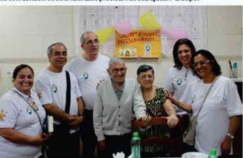
Adaptação: Luciana - Pascom

E você? Tem vontade de ir ao encontro das pessoas em casa e levar a palavra de Deus? Quer se envolver nessa missão? Procure a Secretária da Igreja ou um dos coordenadores setoriais. Eles precisam de sua ajuda. Participe!