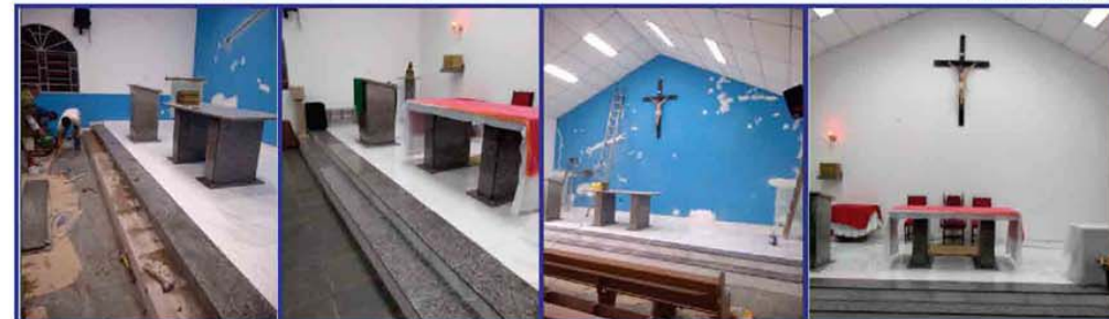
A Capela de Nossa Senhora Aparecida e Santo Expedito faz parte de nossa Paróquia. Localiza-se na Rua Gambos, pertinho do Parque Central. Visite e participe desta singela Capela e conheça sua comunidade tão acolhedora!