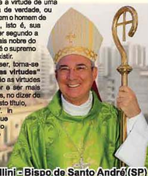
Dom Pedro Cipollini - Bispo de Santo André (SP)

Por mais difícil que possa ser, torna-se hoje necessária uma "ética das virtudes" que nos faça mais humanos. São as virtudes que fazem um homem parecer e ser mais humano do que outro e sem elas, no dizer do filósofo Spinoza, seríamos, a justo título, qualificados de inhumanos (cf. in Ética, IV, prop. 50). Será que estamos nos desumanizando aos poucos, nos tornando apáticos e indiferentes, ao não propormos mais as virtudes como valores?