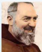
23 de setembro Dia de São Pio de Pietrelcina