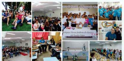
12º Encontro de Casais em 2ª União

Vale citar que São João Paulo II disse que os casais em segunda união podem e devem participar da vida da Igreja, porque o divórcio não lhes tira a fé e o valor do batismo. Eles pertencem à Igreja, por isso têm o direito de fazer dela sua casa, sua tenda, de sentir-se bem dentro dela como em suas casas e de serem acolhidos como irmãos.